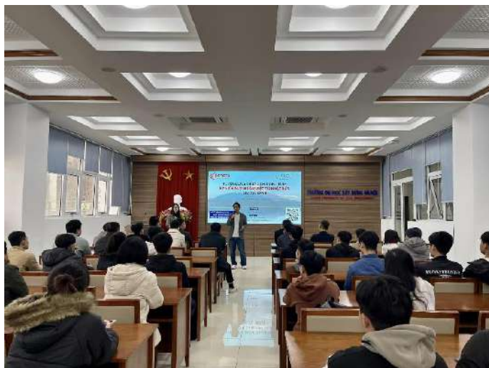
▲ベトナム人学生へのプログラム説明会の様子

※BIM/CIMとは：建築・土木分野において計画・調査・設計段階から3次元モデルを導入することにより、設計・施工・維持管理の品質向上や生産性向上を目的とした取り組みのこと。