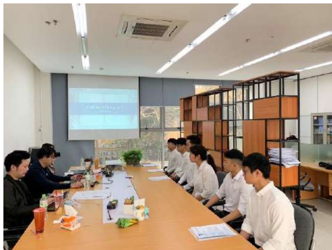
▲プログラム参加希望者との面談の様子